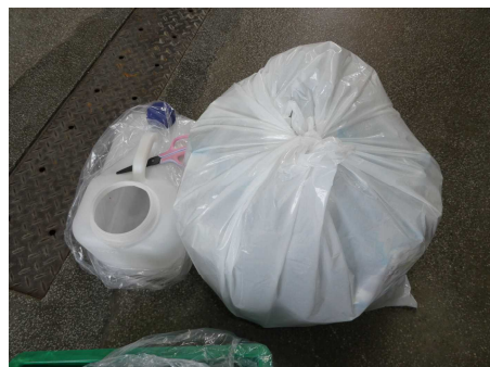
完食の牛乳パック